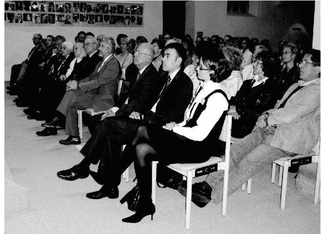
Krisen zwischen Leiden und Wachsen. Wie wir einander helfen können. Kreuzkirche, 08.10.2008